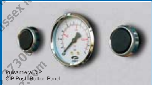
Pulsantiera CIP CIP Push-Button Panel